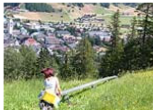
Discesa col Fun-Bob ( www.funbob.it )